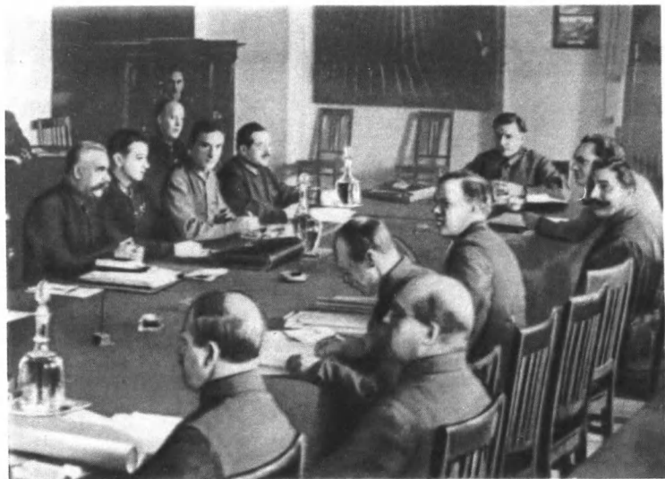
Заседает Реввоенсовет СССР. 1927 г.