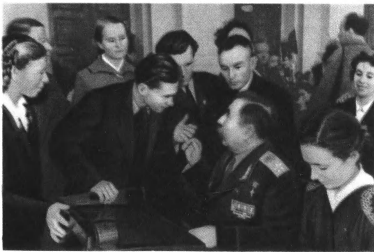
В гостях у комсомольцев