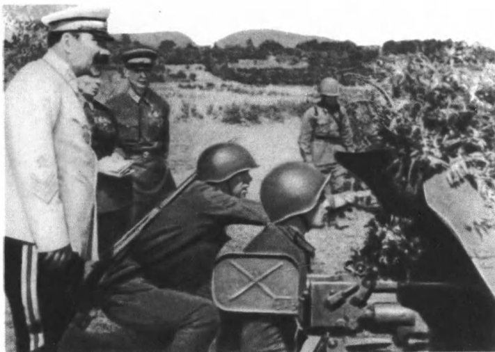
Первый заместитель наркома обороны Маршал Советского Союза С. М. Буденный на тактических учениях в Закавказском военном округе. 1940 г.