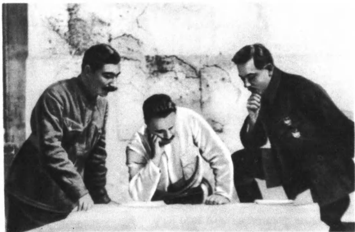
С. М. Буденный, М. В. Фрунзе и К. Е. Ворошилов на врангелевском фронте. 1920 г.