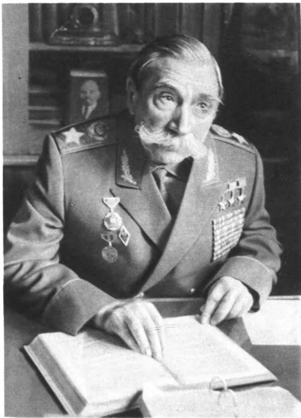
С. М. Буденный в день своего 90-летия