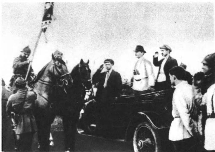
Вручение знамени ВЦИК 1-й Конной армии. В машине стоит М. И. Калинин. Май 1920 г.