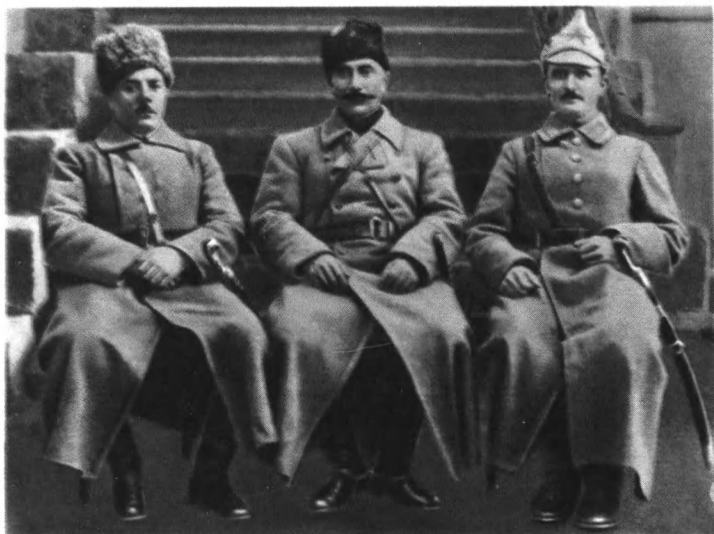
Реввоенсовет 1-й Конной армии: К. Е. Ворошилов, С. М. Буденный, Е. А. Щаденко. 1920 г.