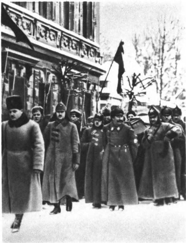
Г. К. Орджоникидзе, С. М. Буденный, К. Е. Ворошилов и другие несут гроб с телом В. И. Ленина от Павелецкого вокзала к Дому Союзов. 23 января 1924 г.