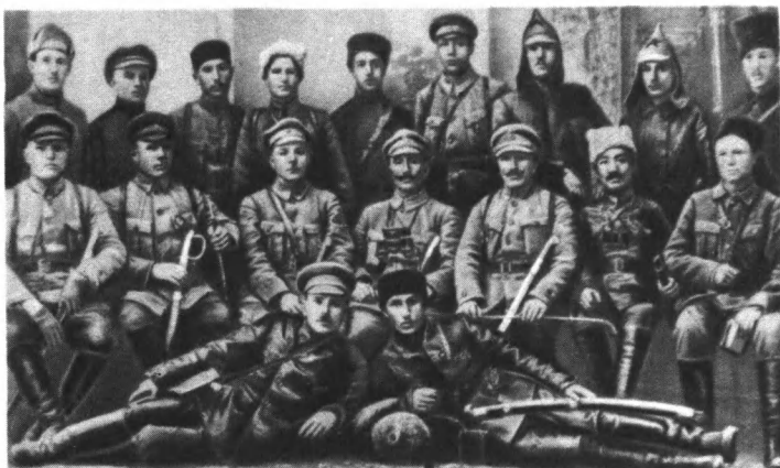
К. Е. Ворошилов и С. М. Буденный с командным и политическим составом Конармии. Майкоп, март 1920 г.