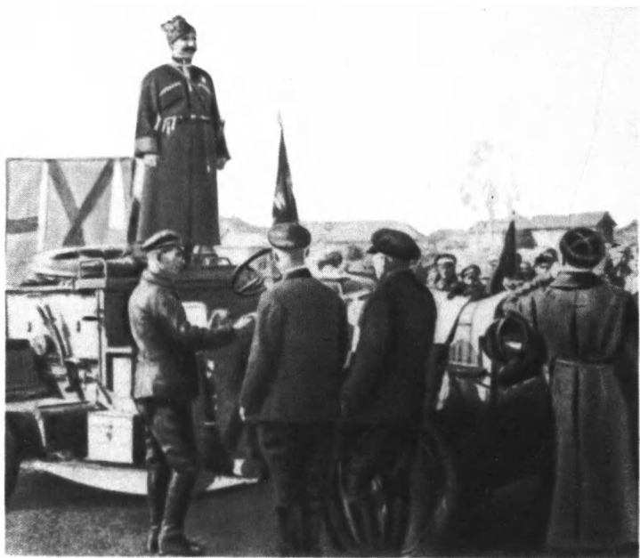
С. М. Буденный выступает перед бойцами 1-й Конной армии. Ноябрь 1920 г.