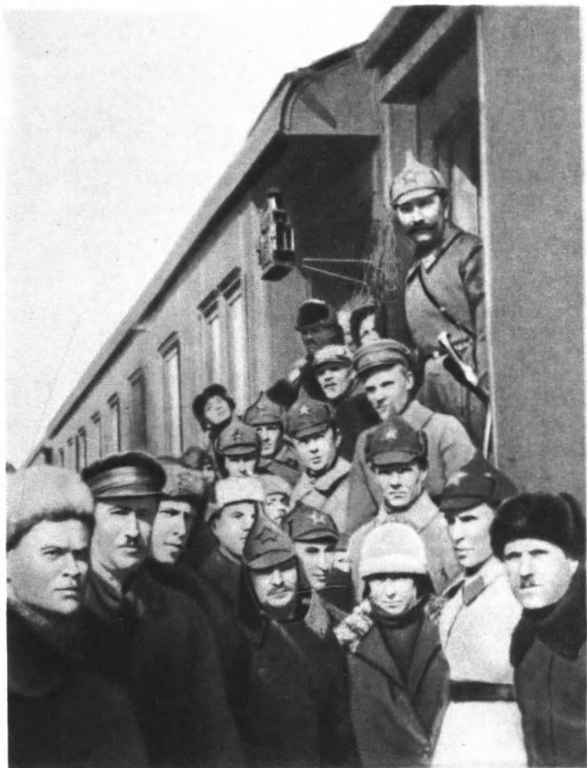
Встреча С. М. Буденного с группой сибирских партизан. Март 1929 г.