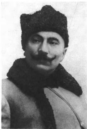
С. М. Буденный — командарм 1-й Конной